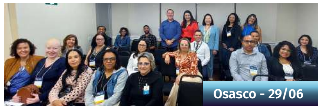
Osasco - 29/06