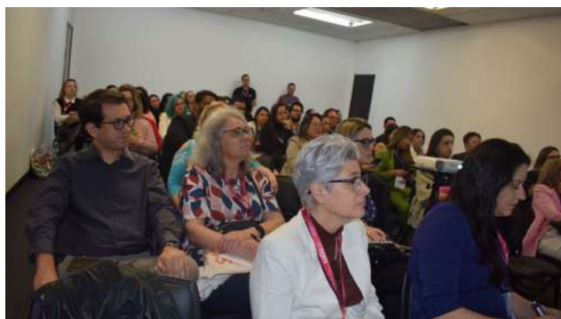
Público presente nas atividades realizadas pelo CRF-SP na Consulfarma