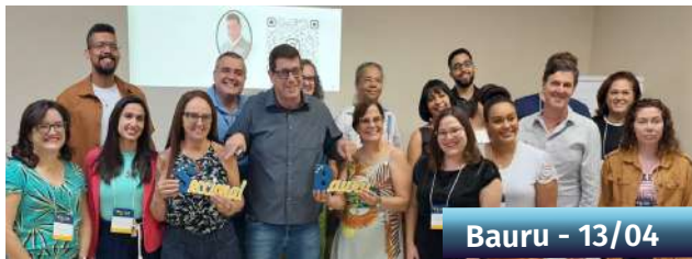
Bauru - 13/04