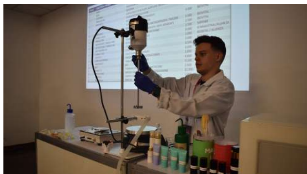
Atividade prática durante o encontro de professores de Farmacocinética e Cosmetologia