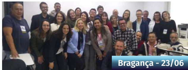
Bragança - 23/06