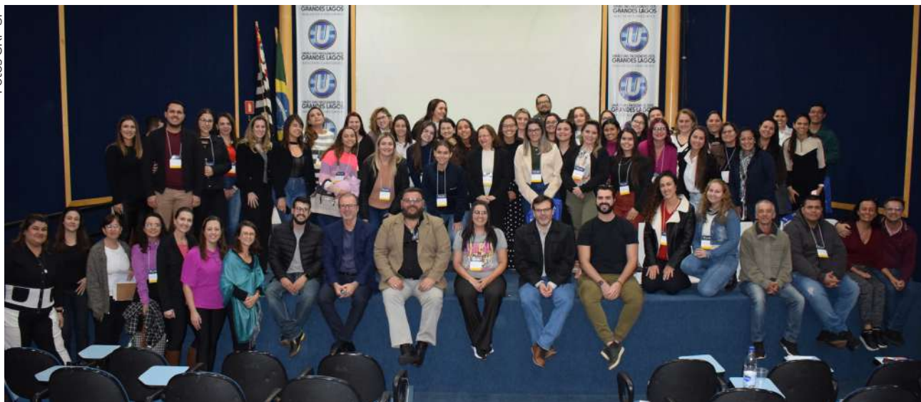
Participantes do I Simpósio do Noroeste Paulista