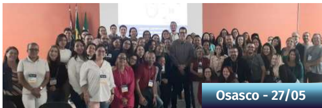
Osasco - 27/05