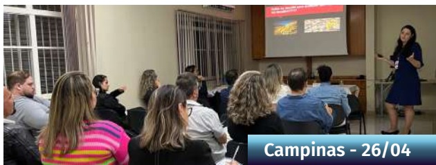
Campinas - 26/04