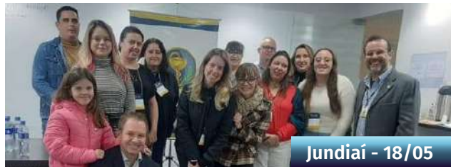
Jundiaí - 18/05