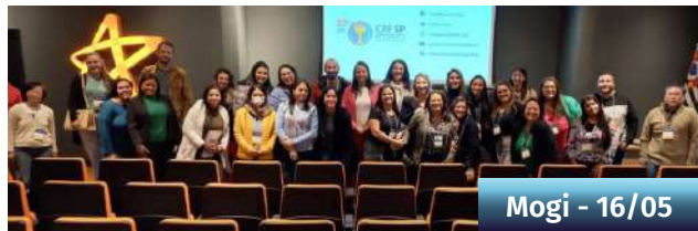
Mogi - 16/05