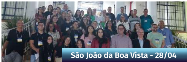
São João da Boa Vista - 28/04