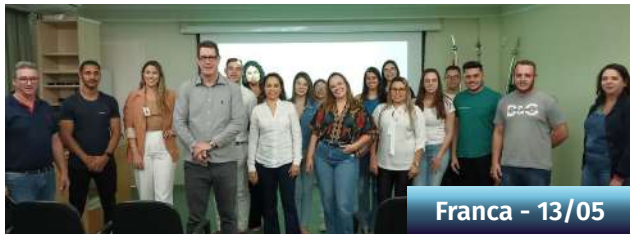
Franca - 13/05