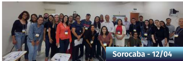
Sorocaba - 12/04