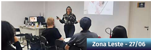
Zona Leste - 27/06