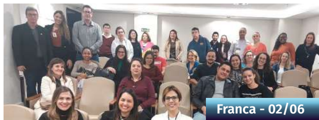
Franca - 02/06