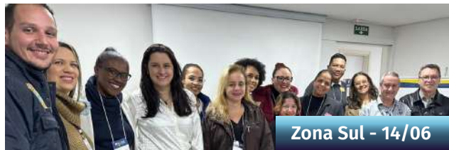
Zona Sul - 14/06