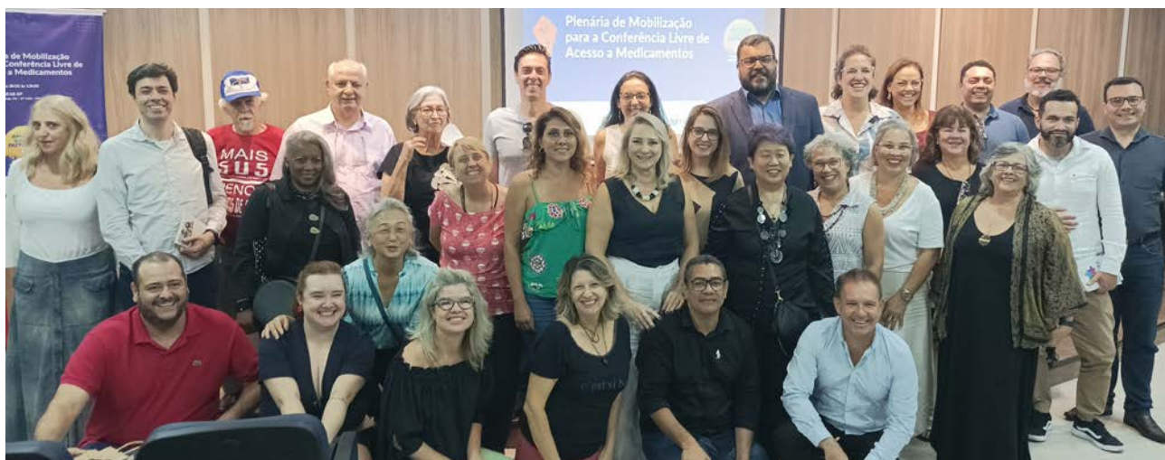
Farmacêuticos e representantes de entidades do setor unidos na construção de novas políticas públicas para o SUS

As Conferências Livres de Saúde são espaços de debate e participação social para construção das políticas do Sistema Único de Saúde (SUS). Com o foco no fortalecimento da assistência farmacêutica e o aprimoramento do acesso ao medicamento, o CRF-SP participou de algumas etapas das discussões como a Plenária de Mobilização para a Conferência Livre de Acesso a Medicamentos, em 1º de abril, na sede do Sindicato dos Farmacêuticos e a Conferência Livre de Acesso a Medicamentos em Defesa da Vida, em 18 de abril, no Congresso Nacional em Brasília.