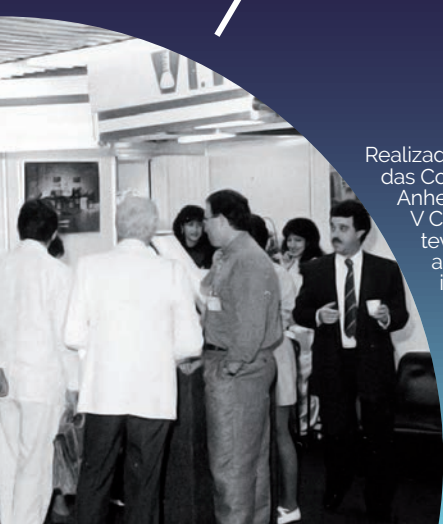
Realizado no Palácio das Convenções do Anhembi em 1985, V Congresso teve como tema as práticas integrativas e complementares no âmbito da Farmácia