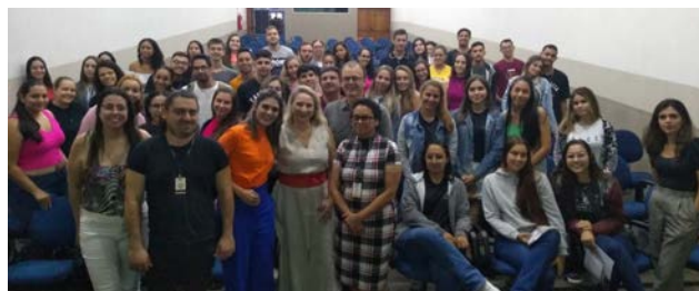
Farmacêuticos e estudantes de farmácia de Fernandópolis e região tiraram dúvidas durante a palestra