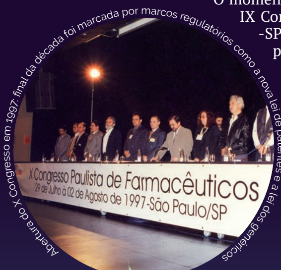
Abertura do X Congresso em 1997, final da década foi marcada por marcos regulatórios como a nova lei de patentes e a Lei dos Genéricos

Já o X Congresso, em 1997, se pautou pela nova lei de patentes, em vigor desde 1996, que reconhecia a propriedade comercial dos medicamentos, fármacos e alguns alimentos.