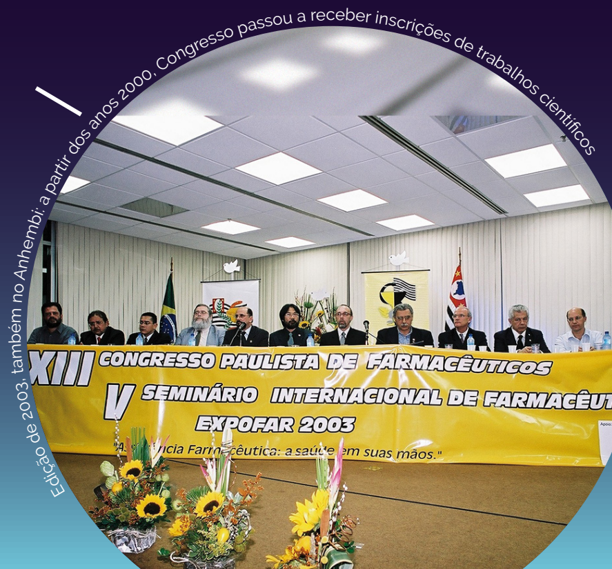
Edição de 2003, também no Anhembi; a partir dos anos 2000, Congresso passou a receber inscrições de trabalhos científicos