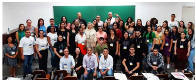
Em Osasco, o tema debatido foi Telefarmácia