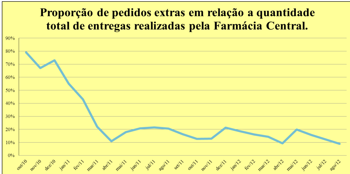
GRÁFICO 3 – Proporção de pedidos extras em relação a quantidade total de entregas realizadas pela Farmácia Central